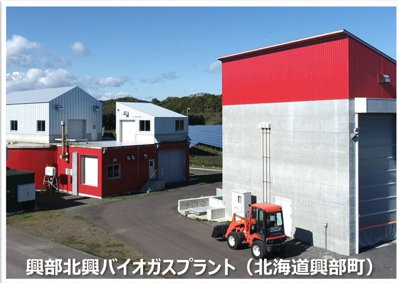
興部北興バイオガスプラント (北海道興部町)