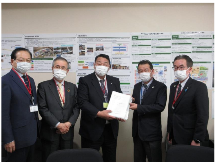
環境省 大臣官房 環境計画課