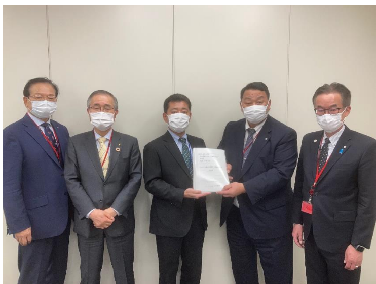
国土交通省 下水道部 下水企画課