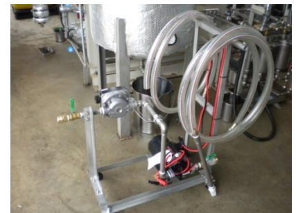
廃油回収ポンプ2セット