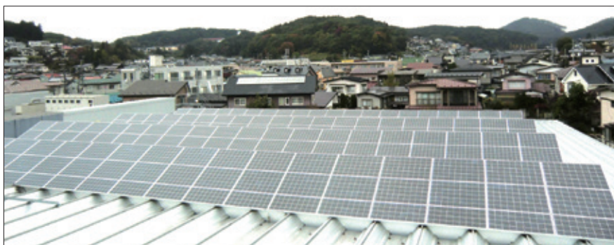
ベルフ山岸店 49kw 太陽光発電

太陽光発電は2013年度に店舗等事業所の屋根に96kw設置し累計225kwとなりました。年間CO 2 削減量は109トンの見通しです。