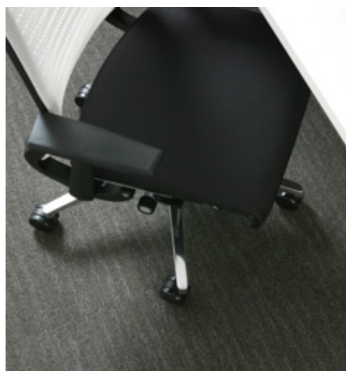
[ タイルカーペット ] 上層繊維に植物由来のポリ乳酸とリサイクルPETを使用したタイルカーペット。

古来より親しまれている天然繊維の絹糸と現代の先端科学によって植物から作られるポリ乳酸繊維を融合させた西陣織。