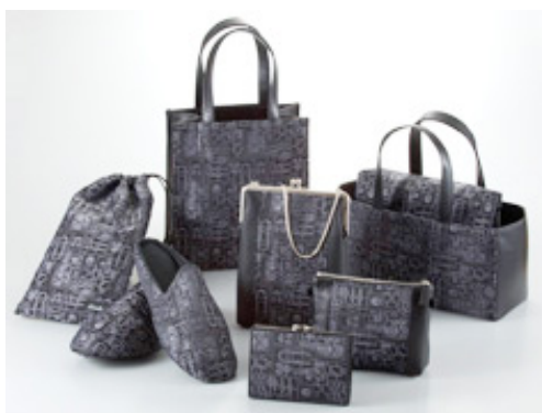
[ 西陣織 GINKAKU ]

古来より親しまれている天然繊維の絹糸と現代の先端科学によって植物から作られるポリ乳酸繊維を融合させた西陣織。