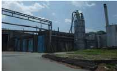
ウッドピア流通協同組合の熱利用設備

松阪木質バイオマス熱利用協同組合では、間伐材・林地残材・製材所端材を活用して隣接する辻製油株式会社、井村屋株式会社の2工場へ蒸気を販売しています。平成26年夏に完成する、うれし野アグリ株式会社の農業用ハウスへも温水を供給予定です。