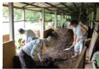
生ゴミリサイクル亀さんの家

飯南町生ごみ堆肥化研究グループでは、各家庭で生ごみの一次処理を行い、飯南地域振興局の駐輪場に作ってもらった堆肥舎に集め、3か月かけて完熟堆肥を作り、家庭菜園や花壇で使用しています。