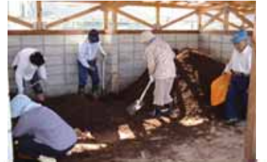
飯南町生ごみ堆肥化研究グループ