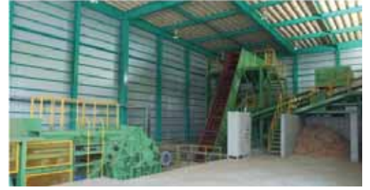
ウッドピア木質バイオマス利用協同組合の破碎施設

ウッドピア木質バイオマス利用協同組合では破碎チップを製造し、松阪木質バイオマス熱利用協同組合へ供給しています。三重エネウッド株式会社が平成26年11月より木質バイオマス発電の操業を開始すると、発電所へのチップ供給も行う計画です。