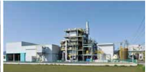
松阪木質バイオマス熱利用協同組合の熱供給設備