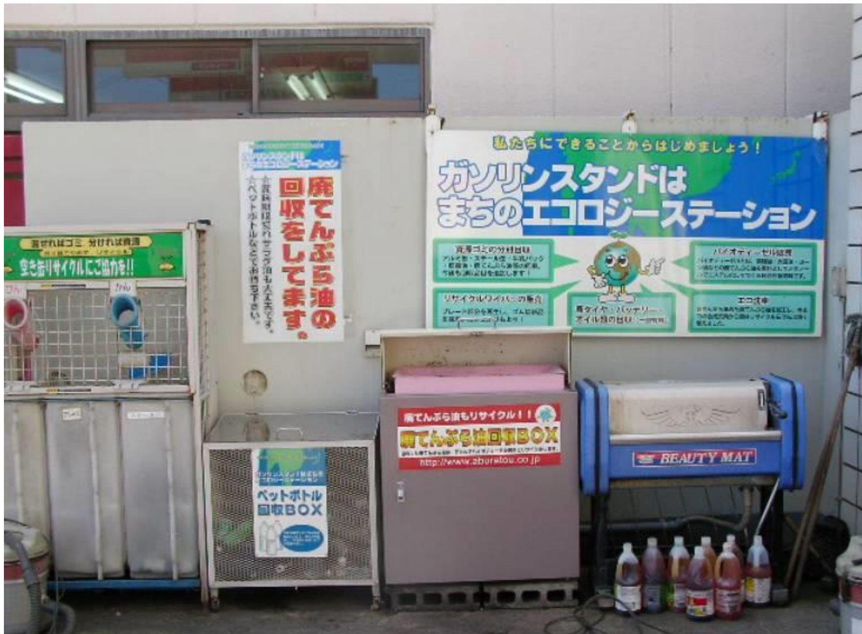
アルミ缶・スチール缶・牛乳パック・ペットボトル回収